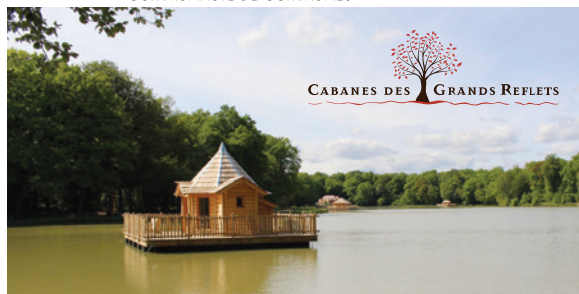
CABANES DES GRANDS REFLETS